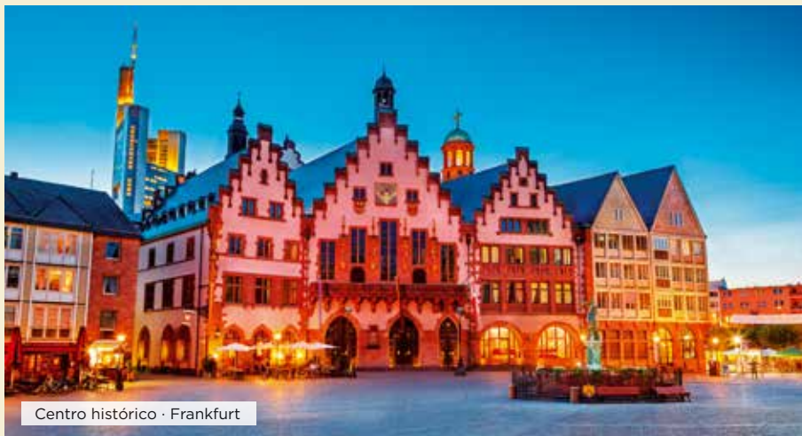
Centro histórico · Frankfurt

Desayuno. Tiempo libre hasta la hora del traslado al aeropuerto para tomar el vuelo a su ciudad de destino. Fin de nuestros servicios. ■