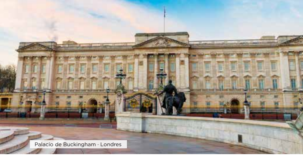
Palacio de Buckingham · Londres