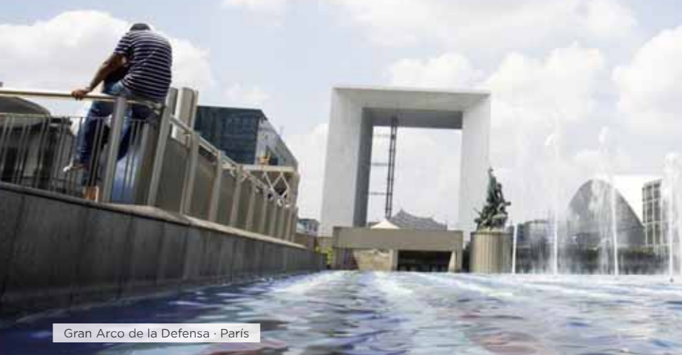
Gran Arco de la Defensa · París