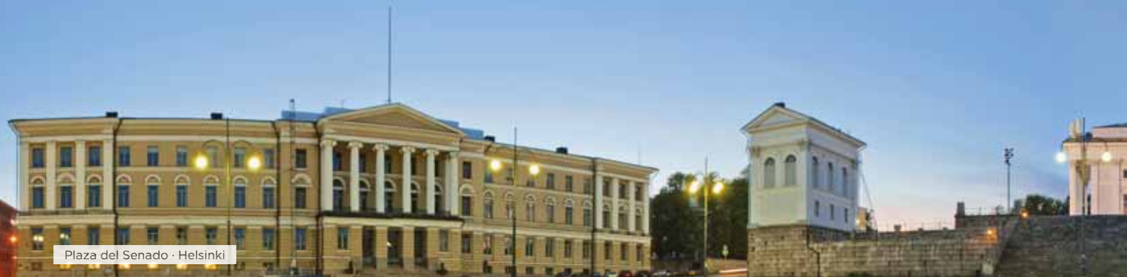
Plaza del Senado · Helsinki