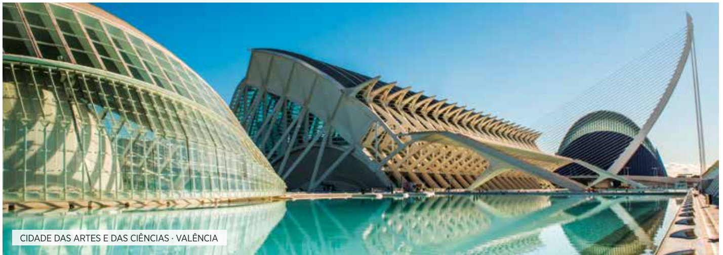
CIDADE DAS ARTES E DAS CIÊNCIAS · VALÊNCIA