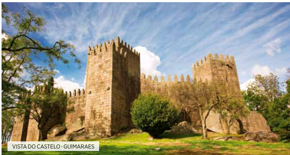
VISTA DO CASTELO · GUIMARAES