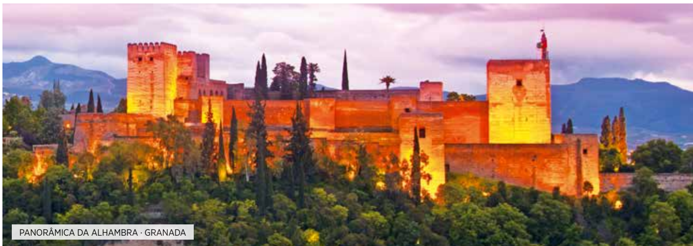
PANORÂMICA DA ALHAMBRA · GRANADA