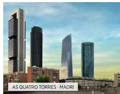
AS QUATRO TORRES · MADRI