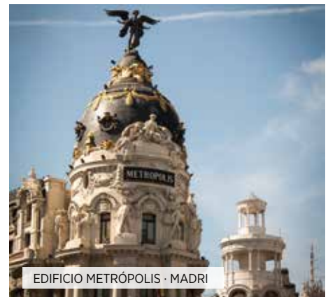
EDIFÍCIO METRÓPOLIS · MADRI