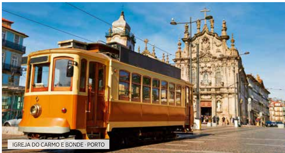
IGREJA DO CARMO E BONDE - PORTO