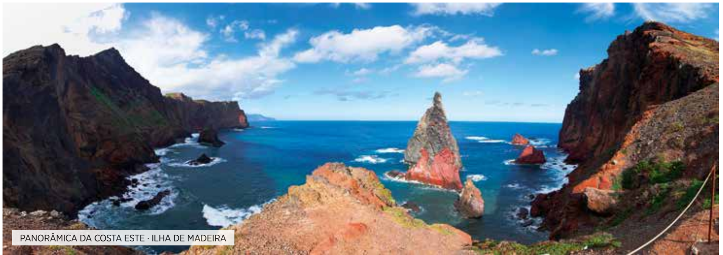
PANORÂMICA DA COSTA ESTE · ILHA DE MADEIRA