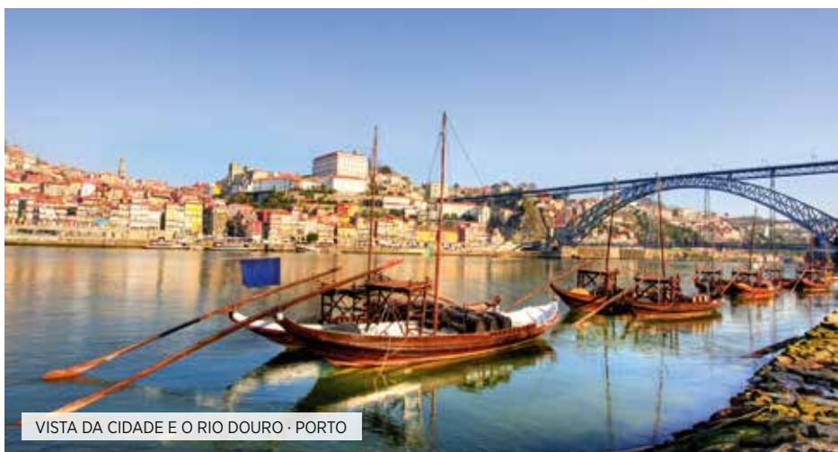
VISTA DA CIDADE E O RIO DOURO - PORTO