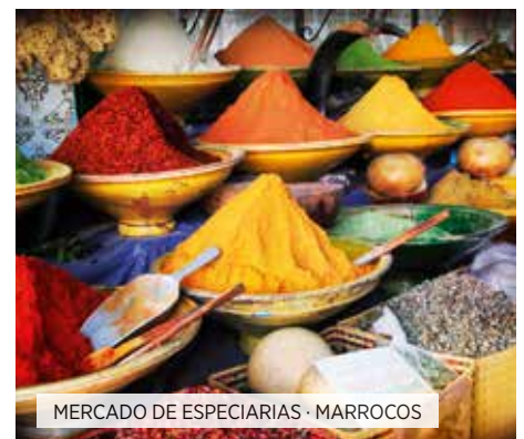
MERCADO DE ESPECIARIAS · MARROCOS