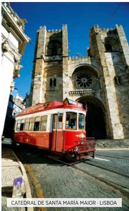
CATEDRAL DE SANTA MARÍA MAIOR · LISBOA

Café da manhã. Saída para Córdoba, capital do Estado Bético durante o Império Romano e do Califado de Córdoba durante o período muçulmano na Espanha, chegando a ser a maior cidade ocidental do século X, berço de grandes filósofos, científicos e artistas. Tempo livre para