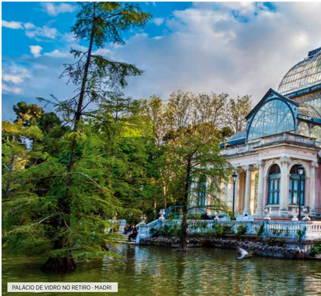
PALÁCIO DE VIDRO NO RETIRO · MADRI