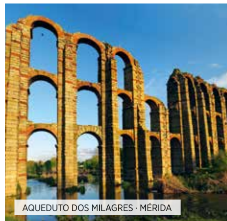
AQUEDUTO DOS MILAGRES · MÉRIDA