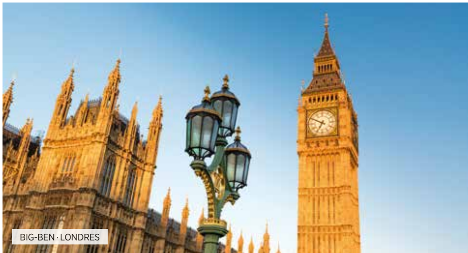
BIG-BEN · LONDRES