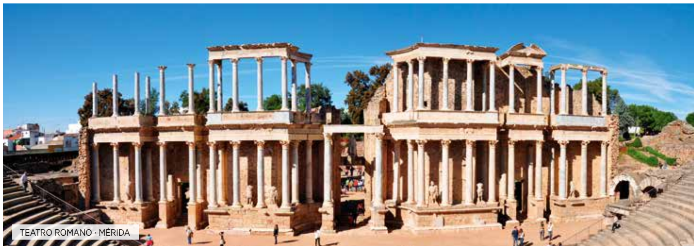
TEATRO ROMANO · MÉRIDA