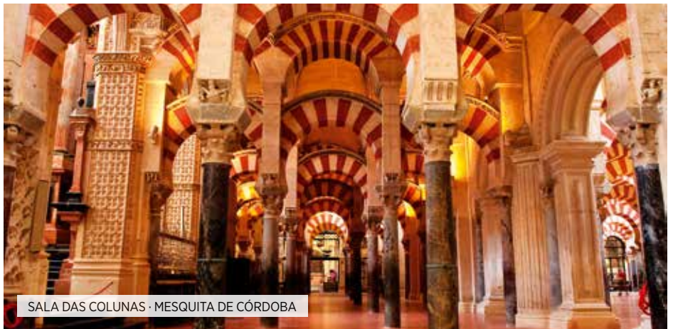
SALA DAS COLUNAS - MESQUITA DE CÓRDOBA

Café da manhã. Visita panorâmica da parte mais característica de Porto, conhecendo o centro histórico considerado Patrimônio da Humanidade pela UNESCO: a Praça dos Aliados, a Igreja Sé da Lapa, edifício de estrutura românica. Dos séculos XII e XIII, que sofreu grandes remodelações no período barroco, visitaremos seu interior para conhecer o mausoléu onde se encontra o coração de D. Pedro I do Brasil e IV de Portugal, etc. Também visitaremos uma adega de vinhos do Porto e realizaremos um passeio em barco pelo Rio Douro, de onde conheceremos as pontes mais importantes: Freixo, Dona Maria II, São João, do Infante, Luis I e a Arrábida. Tarde livre ou, se desejar, poderá fazer uma excursão opcional a Braga onde, com nosso guia local, visitaremos seu belíssimo centro histórico, que conheceu seu esplendor a partir do século XVI, em que se converteu em cidade episcopal. Também visitaremos o Bom Jesus, com sua maravilhosa escada barroca, segundo centro religioso mais importante de Portugal depois de Fátima, e que subiremos no teleférico mais antigo da Europa. Acomodação.