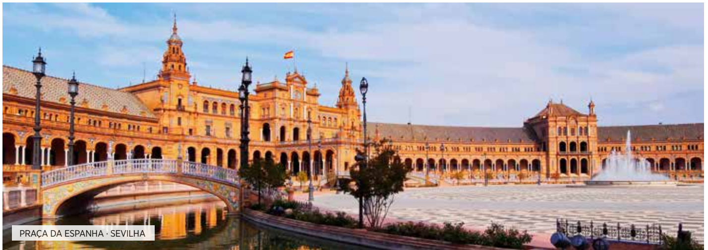
PRAÇA DA ESPANHA · SEVILHA