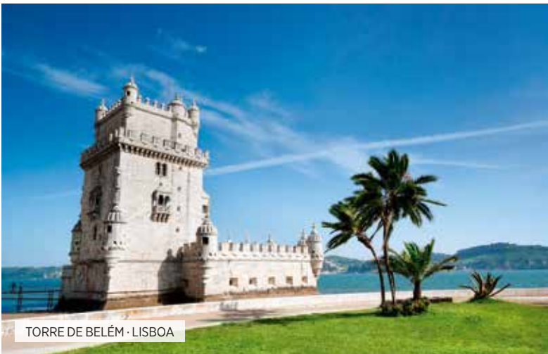
TORRE DE BELÉM · LISBOA