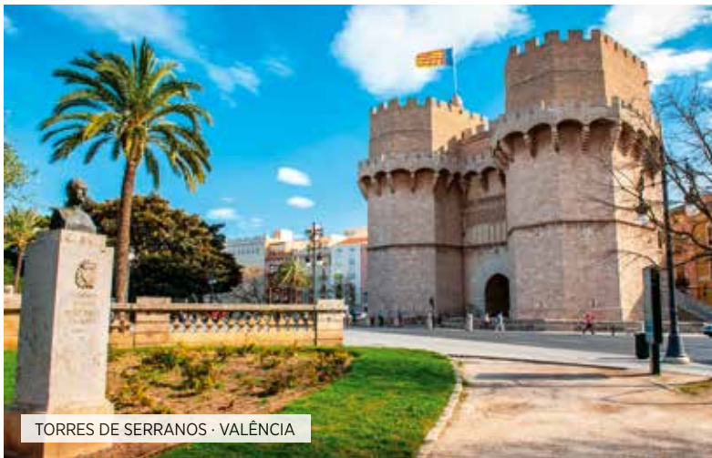
TORRES DE SERRANOS · VALÈNCIA