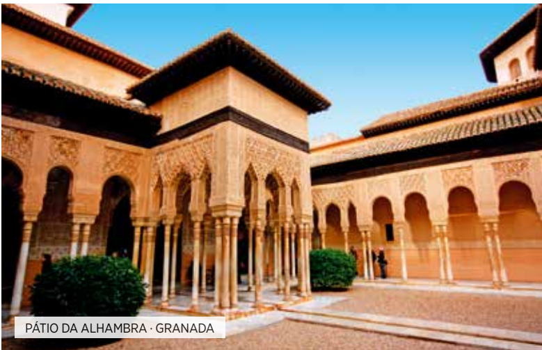
PÁTIO DA ALHAMBRA · GRANADA