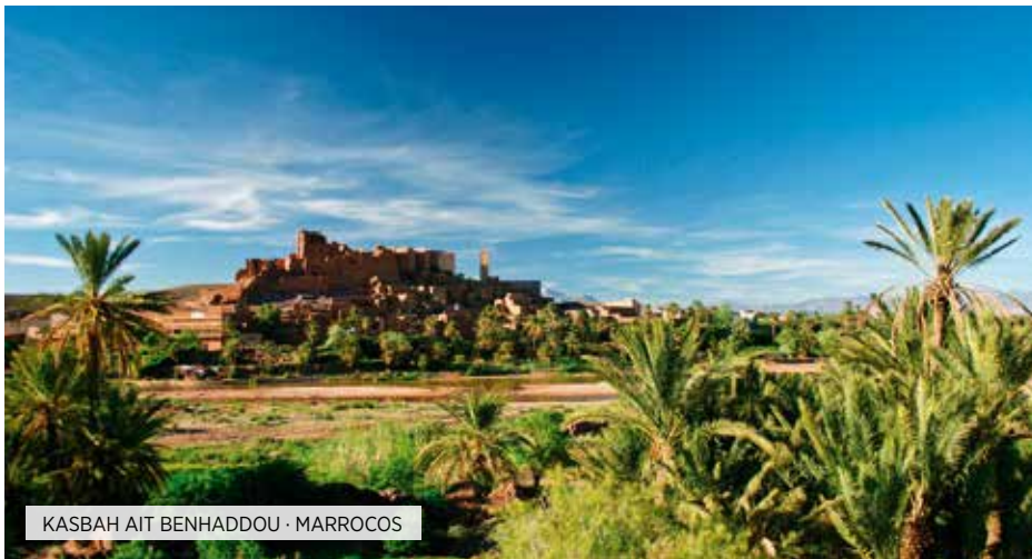
KASBAH AIT BENHADDOU · MARROCOS