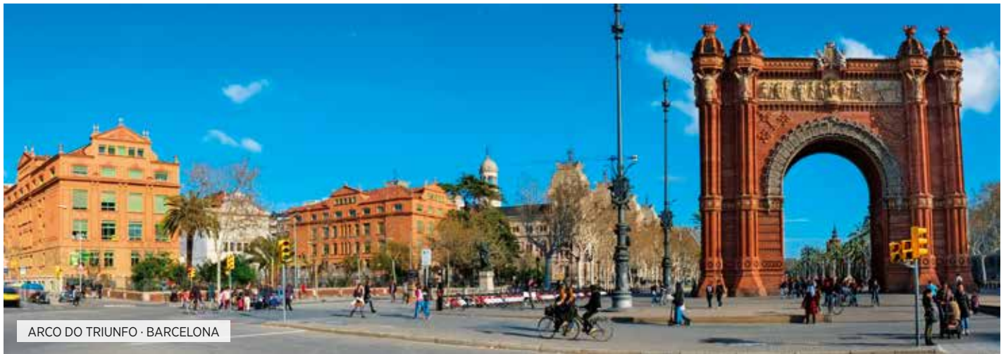
ARCO DO TRIUNFO · BARCELONA