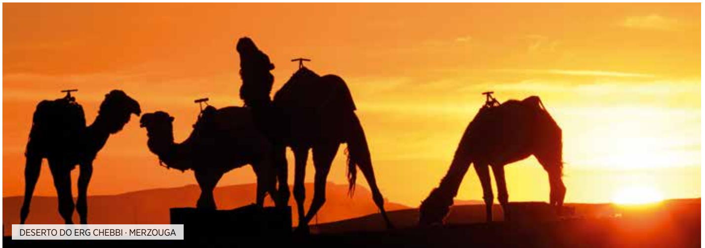
DESERTO DO ERG CHEBBI · MERZOUGA