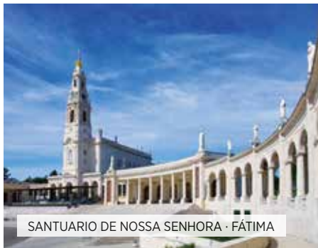
SANTUÁRIO DE NOSSA SENHORA · FÁTIMA

Café da manhã. Saída para Guimarães, berço de Portugal. Tempo livre para conhecer seu centro histórico declarado Patrimônio da Humanidade pela UNESCO, com seu labirinto de calçadas, muito bem conservados e de aspecto medieval. Continuação à Vila Real, cidade fundada por agricultores e pastores para criar um lugar próximo para