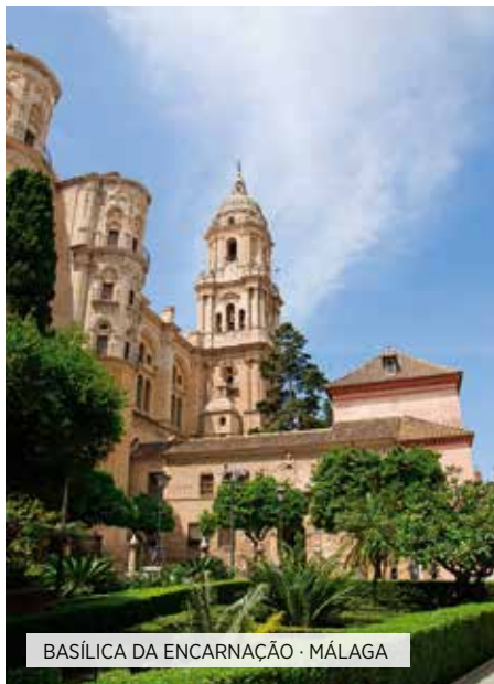
BASÍLICA DA ENCARNAÇÃO · MÁLAGA

Café da manhã. Pela manhã visita panorâmica da cidade: Praça da Espanha, situada no coração do conhecido Parque Maria Luisa e construída devido a Exposição Universal de 1929, Bairro da Santa Cruz onde se encontrava