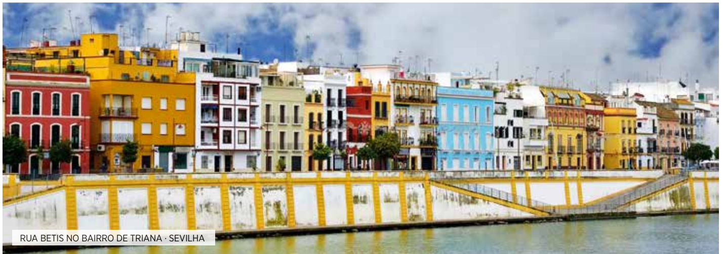
RUA BETIS NO BAIRRO DE TRIANA · SEVILHA