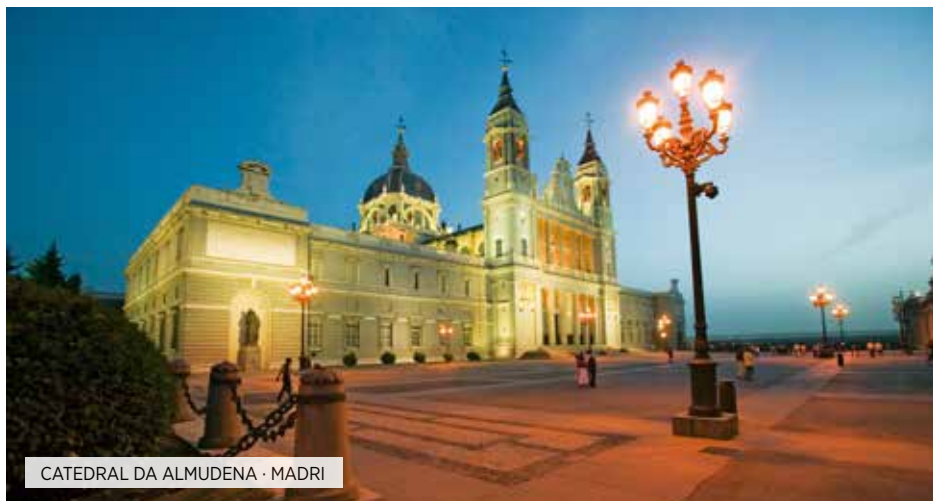
CATEDRAL DA ALMUDENA · MADRI