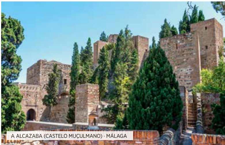
A ALCAZABA (CASTELO MUÇULMANO) · MÁLAGA