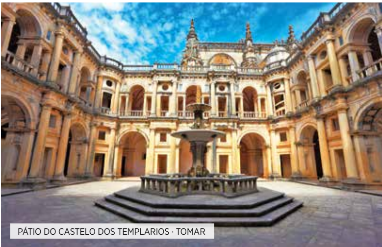
PÁTIO DO CASTELO DOS TEMPLÁRIOS · TOMAR