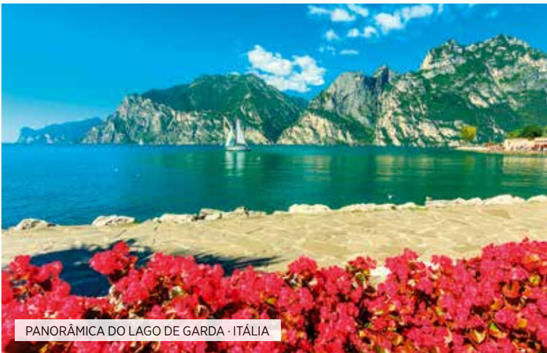
PANORÂMICA DO LAGO DE GARDA · ITÁLIA