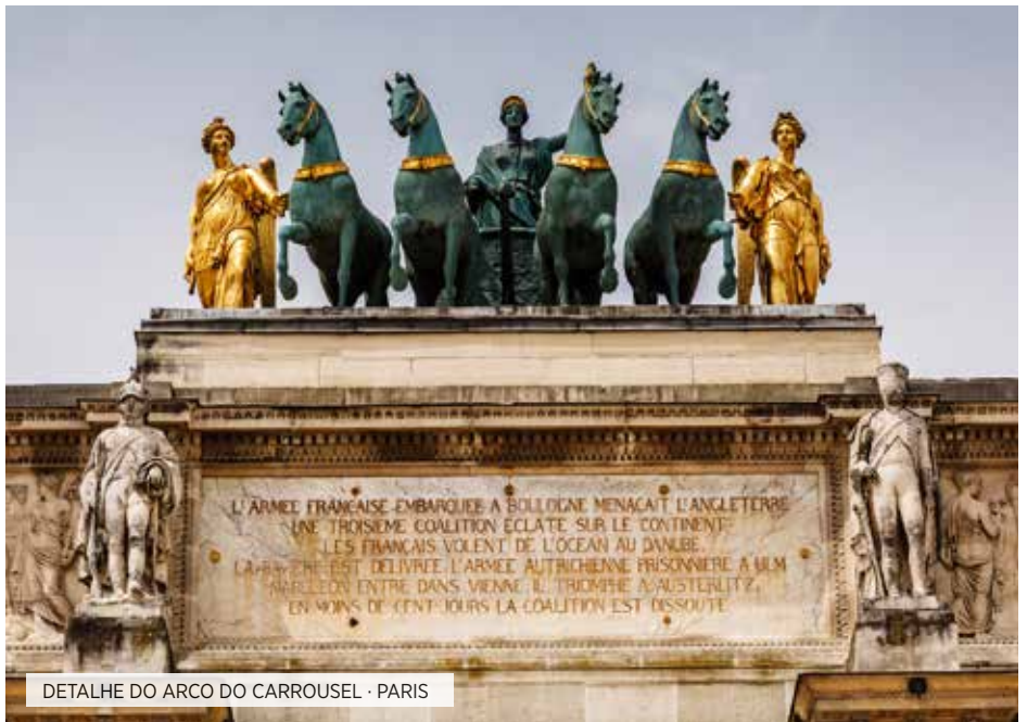
DETALHE DO ARCO DO CARROUSEL · PARIS

Café da manhã. Saída para Córdoba, capital da província Bética durante o Império Romano e do Califato de Córdoba durante o período muçulmano na Espanha, chegando a ser a maior cidade do ocidente no século X e berço de grandes filósofos, científicos e artistas. Tempo livre para