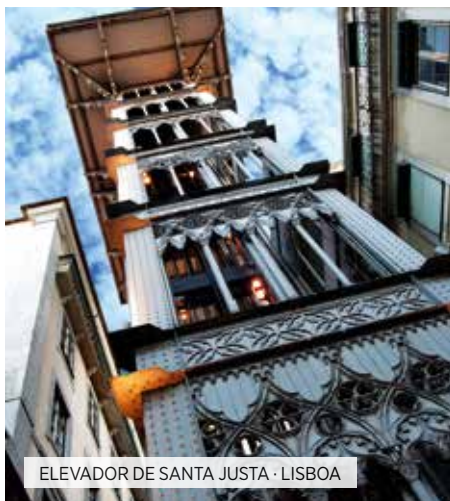
ELEVADOR DE SANTA JUSTA · LISBOA

Café da manhã. Saída para Mérida, uma das cidades mais importantes da Espanha durante a ocupação Romana da Península Ibérica. Fundada por Octavio Augusto em 25 a.C. com o nome de Emérita Augusta e declarada Patrimônio da Humanidade pela UNESCO no ano 1993 devido ao seu importante conjunto arqueológico e monumental. Tempo livre para conhecer seu maravilhoso legado, onde se destaca seu teatro de excelente acústica e ainda em funcionamento nos dias atuais. Continuação à Madri. Res-