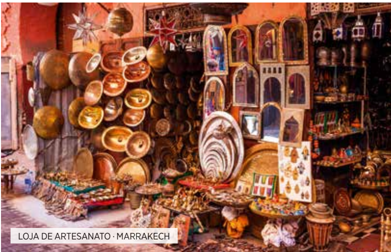
LOJA DE ARTESANATO · MARRAKECH