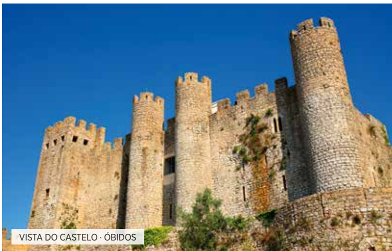
VISTA DO CASTELO · ÓBIDOS