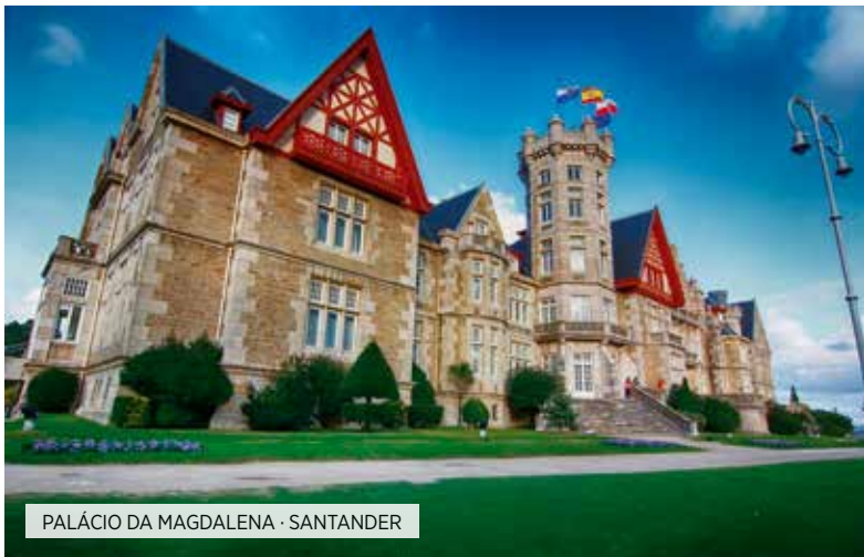
PALÁCIO DA MAGDALENA · SANTANDER