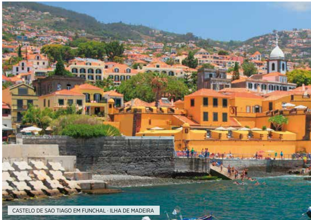
CASTELO DE SAO TIAGO EM FUNCHAL · ILHA DE MADEIRA

Café da manhã. Realizaremos uma excursão de dia inteiro para Porto Moniz, onde descobrirão a costa oeste de Madeira. Começaremos nosso percurso no povoado pesqueiro da Câmara de Lobos e continuação à Ribeira Brava, Ponta do Sol, Calheta, o platô de Pau da Serra até chegar em Rabasal. Percorreremos a costa norte até Porto Moniz e São Vicente. Almoço. Seguiremos cruzando o Vale até Encumeada de onde poderão observar o mar tanto do lado norte como do lado sul da ilha. Antes do retorno para Funchal, realizará uma parada em Cavo Girão (o penhasco mais alto da Europa). Retorno ao hotel. Jantar e acomodação.