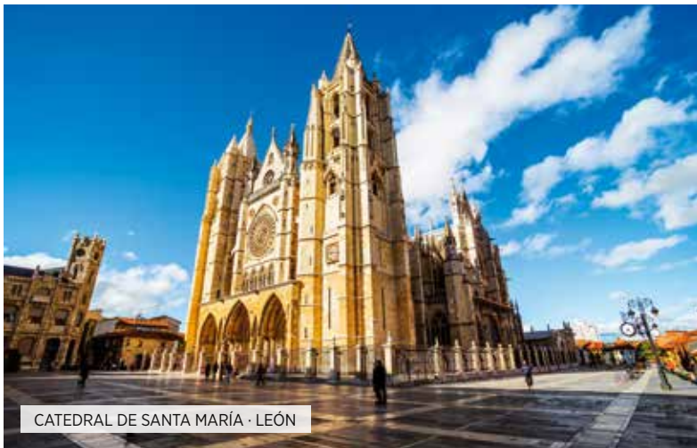
CATEDRAL DE SANTA MARÍA · LEÓN