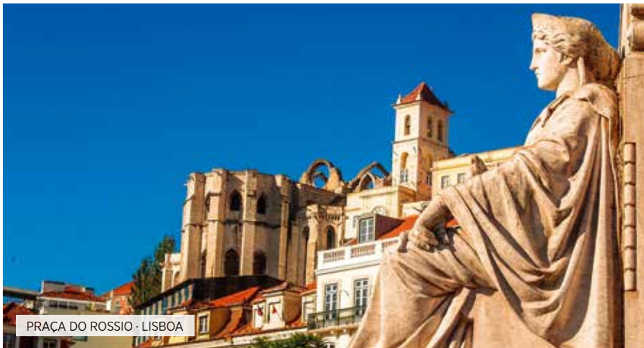
PRAÇA DO ROSSIO · LISBOA