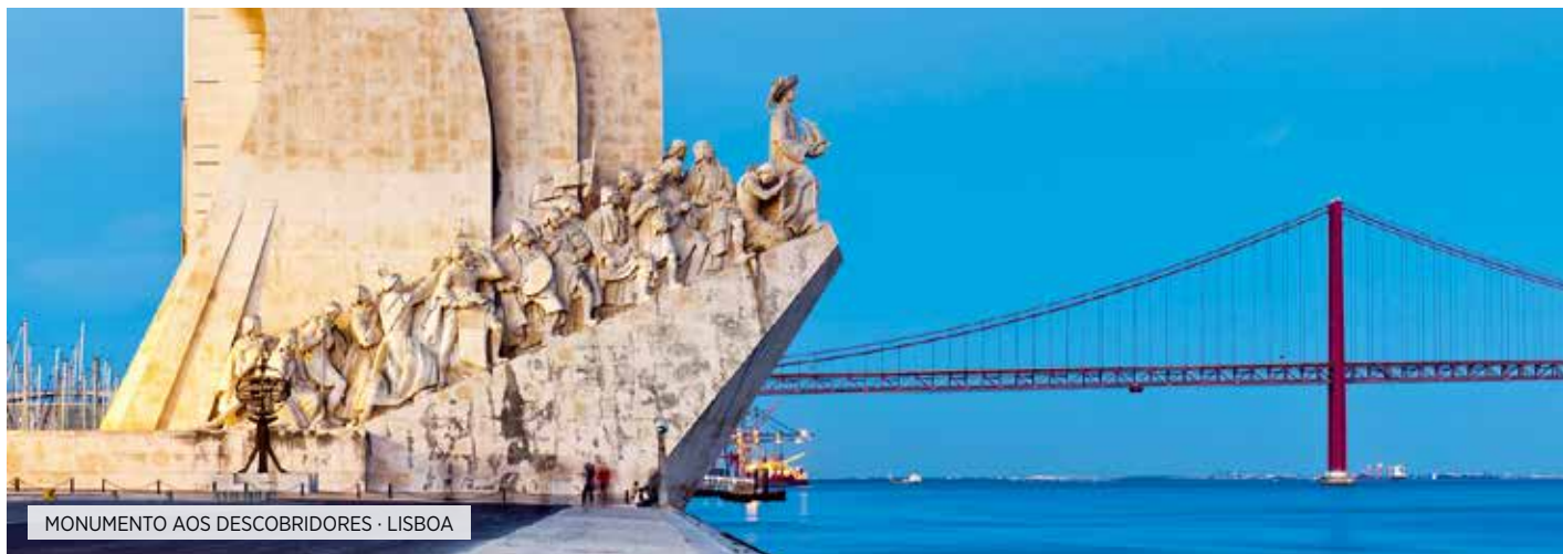
MONUMENTO AOS DESCOBRIDORES - LISBOA