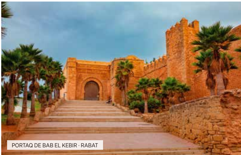
PORTA DE BAB EL KEBIR · RABAT