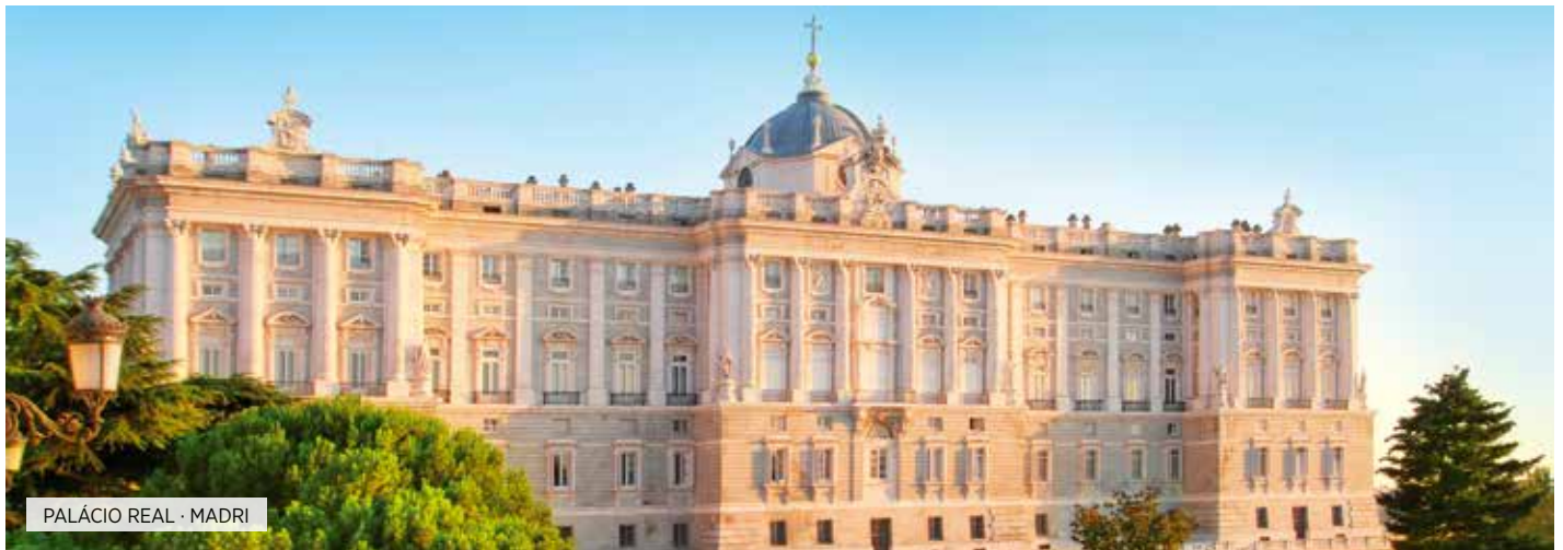
PALÁCIO REAL - MADRI