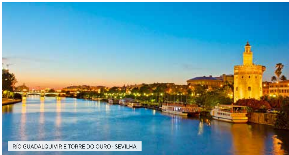
RÍO GUADALQUIVIR E TORRE DO OURO · SEVILHA