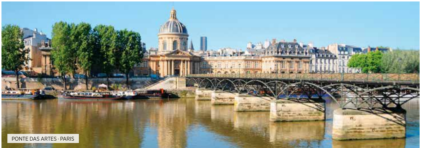
PONTE DAS ARTES · PARIS